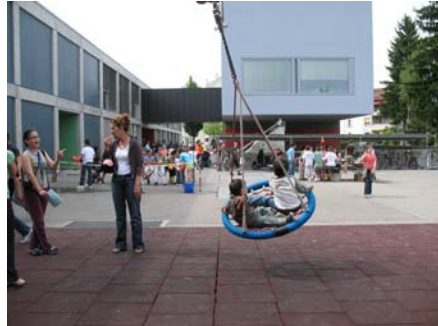
Einweihungsfest Spielplatz Seefeld