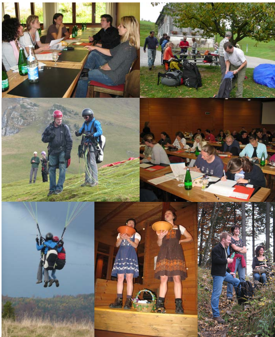
Teamarbeit, sportliche & kulturelle Höhenflüge am Oberstufenseminar

Die gemeinsamen Anlässe der ganzen Schule wurden auf einen grossen Anlass in der Vorweihnachtszeit reduziert: Ein Weihnachtessen im Zürcher Unterland, für viele schon etwas weit weg, guter Beteiligung, exzellentem Essen und einer Heimfahrt durch verschneite Landschaften. Vereinzelt unregelmässige Events unter dem Jahr sollen die Tradition der Teamanlässe ergänzen.