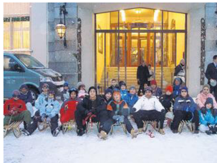
Schneelager P5c im Engadin