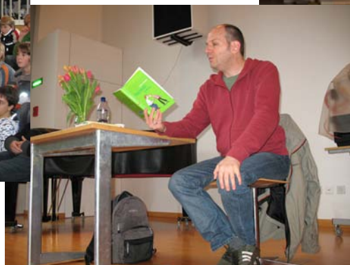
Lesung mit Andres Steinhöfel (Juni 08)