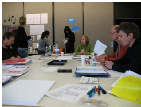
Steuergruppe an der Arbeit

Die Schulpflege hat an ihrer Sitzung im April 2007 den strategischen Entscheid gefällt, auf das Schuljahr 2009/2010 Integrative Schulung an der Schule Spreitenbach einzuführen. Eine neue Arbeitsgruppe, welche sich mit der Integrativen Schule befasst, wurde ins Leben gerufen, um den Prozess der Einführung der IS zu gestalten. Aufgrund dieses neuen Schulprogrammepunktes wurden sinnvollerweise in der Steuergruppe keine neuen Qualitätsschwerpunkte bearbeitet.